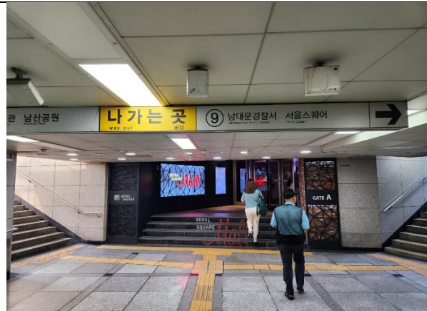
2)"지하철 서울역 9번 출구"에서 바로 서울스퀘어 지하로 연결이 되어있어 있음(지하철 이용 시 9번출구쪽 연결 출입구 이용)