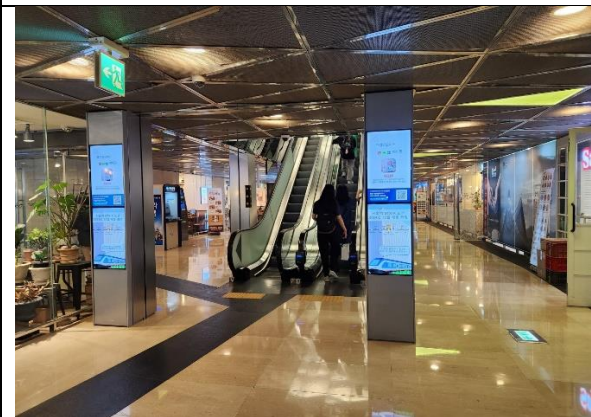
3)지하철역 9번출구쪽 서울스퀘어 연결 출입구로 들어오면 바로 에스컬레이터가 있고, 이걸로 1층까지 오시면 됩니다