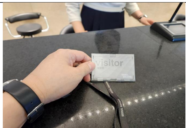
6)신분증을 카드로 교환 후에 "로비 뒤편"으로 돌아서 3층으로 오시면 됩니다 긴급연락 : 02-2038-7777(면접일)