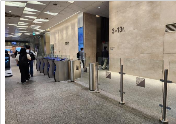
7)출입카드 수령 후에 로비 뒷편으로 오시면 3층으로 올라가는 자동 게이트가 보임