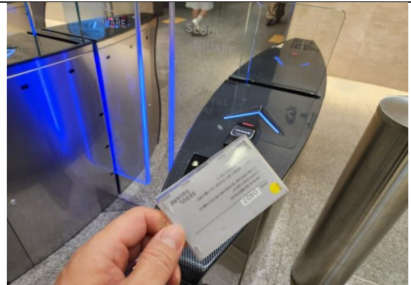
8)카드를 이용해서 게이트로 들어온 후에 엘리베이터를 이용해서 3층으로 오시면 됩니다