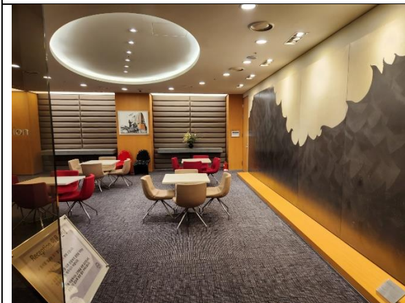
11)대기 장소 및 면접장