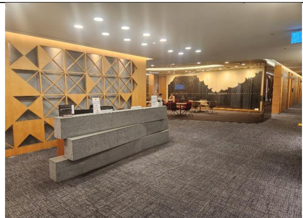
10)안내 데스크에서 "크레센도국제대학교 면접"이라고 말씀하시고 안내 받으시면됩니다.