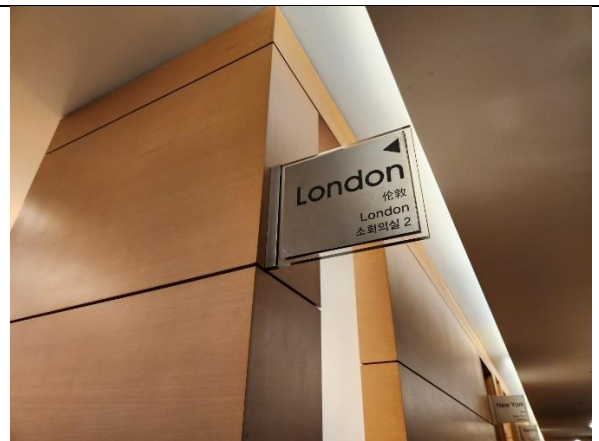
12)대기 장소 및 면접장 대기장으로 오셔서 접수 후에 대기해주시면 면접에 필요한 안내를 받으실 수 있습니다