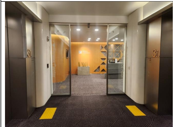
9)"3층"에 내리시면 사진과 같이 컨퍼런스홀이 보임.